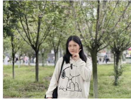
马茹菲-给排水 201701-香港科技大学