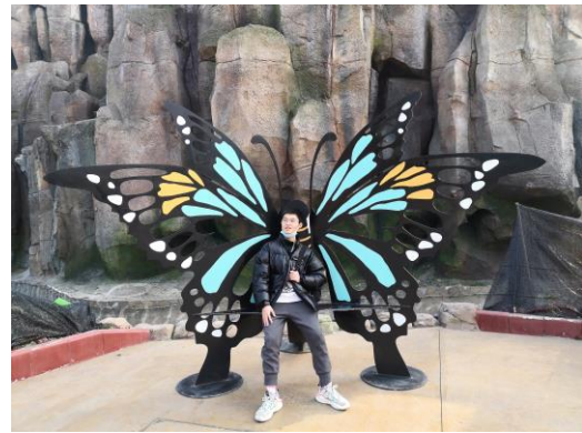
孙德国-给排水 201701-哈尔滨工业大学